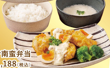
チキン南蛮弁当 1,188(税込)