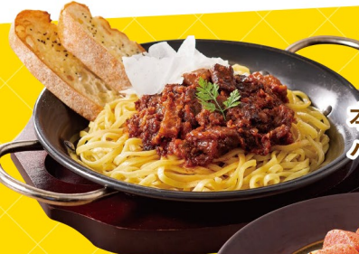
本気のミートソースパスタ 1,188(税込)