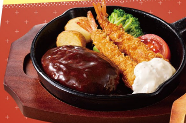
デミグラスハンバーグ&海老フライコンボ 1,158(税込)