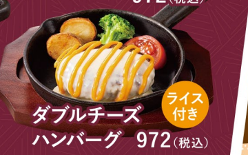
ダブルチーズハンバーグ 972(税込)