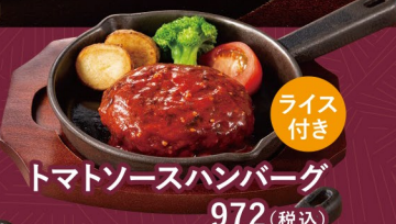
トマトソースハンバーグ 972(税込)