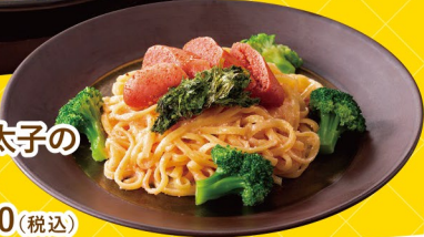
まるごと炙り明太子のクリームパスタ 1,080(税込)