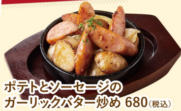
ポテトとソーセージのガーリックバター炒め 680(税込)