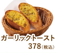
ガーリックトースト 378(税込)