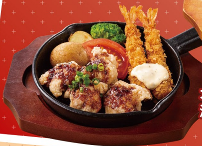
ガーリックチキン&海老フライコンボ 1,158(税込)