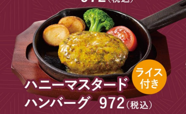
ハニーマスタードハンバーグ 972(税込)