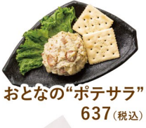
おとなの“ポテサラ” 637(税込)