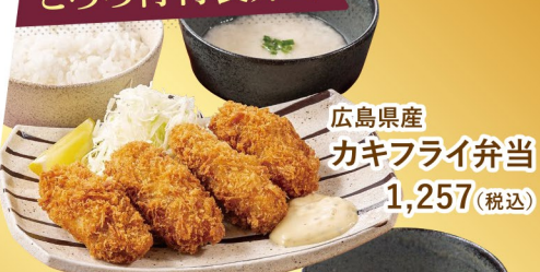
広島県産カキフライ弁当 1,257(税込)