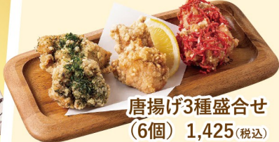
唐揚げ3種盛合せ(6個) 1,425(税込)