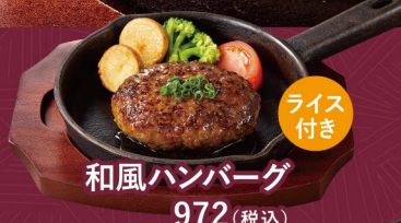
和風ハンバーグ 972(税込)