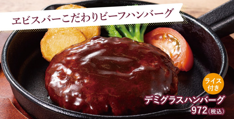
デミグラスハンバーグ 972(税込)