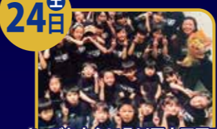
キッズを中心に品川区大田区で 活動するダンスサークル団体です。 DANCE CLUB COLOR'S