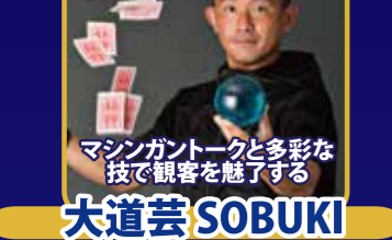
マシンガントークと多彩な 技で観客を魅了する 大道芸 SOBUKI