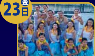
品川にて活動しているフラチームです。 Ke'ala onaona me ka lehua