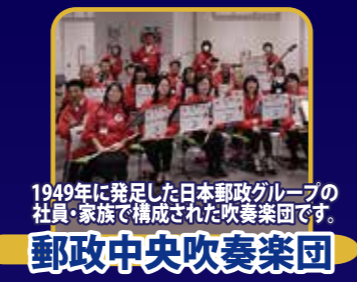
1949年に発足した日本郵政グループの 社員・家族で構成された吹奏楽団です。 郵政中央吹奏楽団