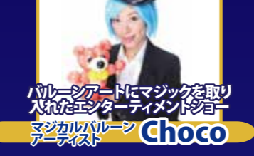
バルーンアートにマジックを取り 入れたエンターテインメントショー マジカルバルーン アーティスト Choco